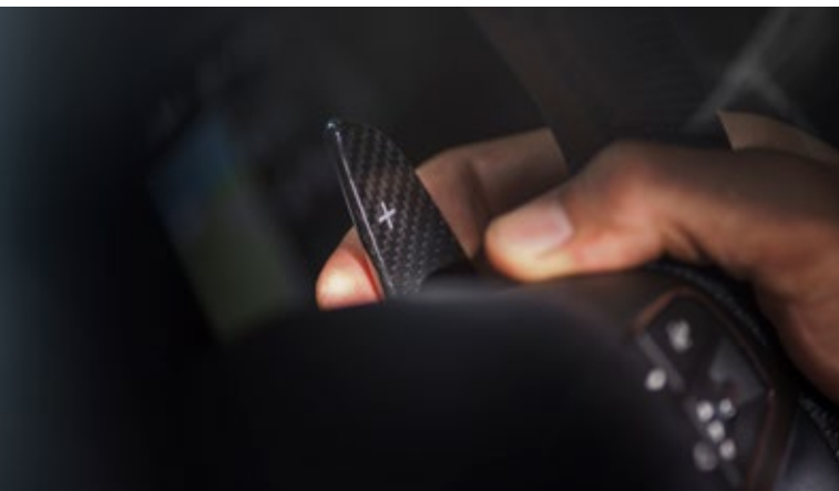
Levante - Schaltwippen