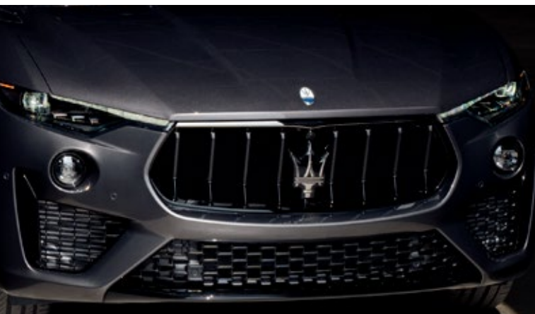
Levante - Kühlergrill