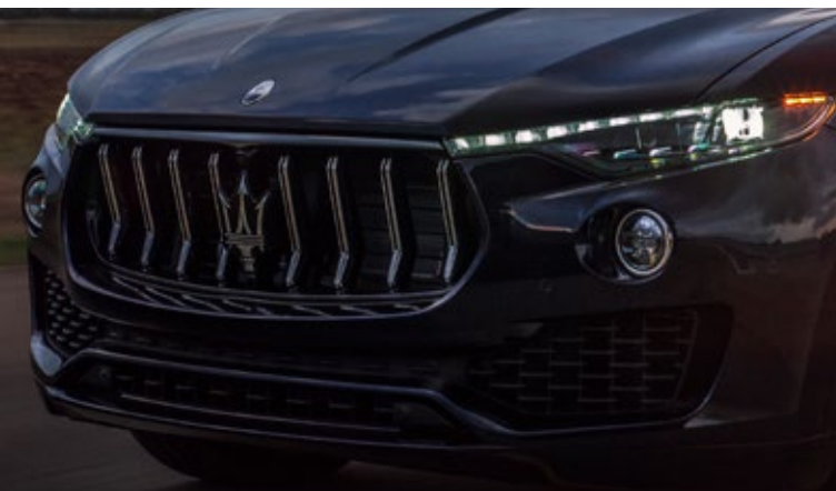
Levante GT - Kühlergrill